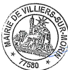
Mme le Maire, Caroline AULIAC

Lorsque les enfants ont terminé leurs devoirs, ils ne doivent pas perturber le bon déroulement de l'étude, ils seront invités à lire ou à dessiner.